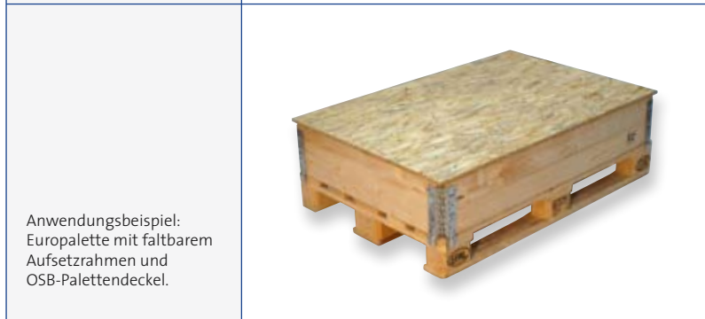
Anwendungsbeispiel: Europalette mit faltbarem Aufsetzrahmen und OSB-Palettendeckel.