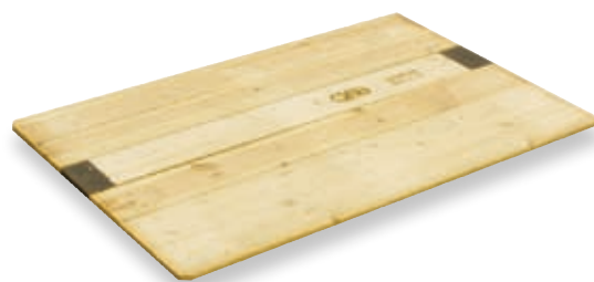
Palettendeckel Önorm A 5314